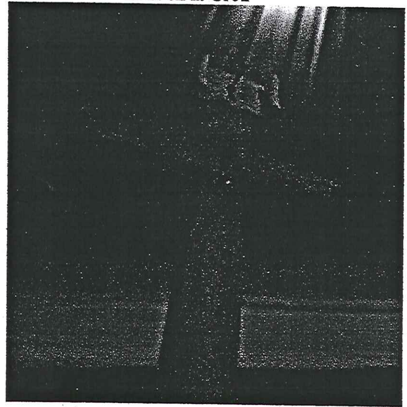
Crist en la Creu

La setmana Santa és el moment litúrgic més intens de tot l'any.